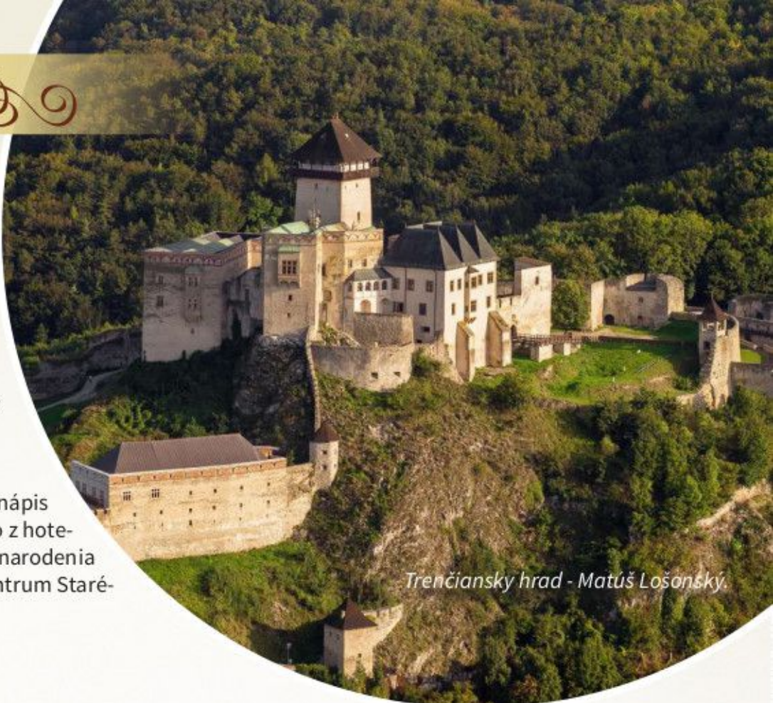
Trenčiansky hrad - Matúš Lošonský.

Morový stĺp, Synagóga, Rímsky nápis na hradnej skale (výhľad priamo z hotela), Mestská veža, Farský kostol narodenia Panny Márie, Farské schody (centrum Starého mesta), Synagóga.